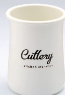
ホーローカトラリースタンド [Cutlery]

材質: 本体/ほうろう用銅板 満水容量: 約930mL 商品サイズ: 約W14.5×D11.0×H14.2cm 商品重量: 約400g