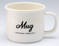
ホーローマグカップ [Mug]

材質: 本体・蓋/ほうろう用銅板 ストレーナー/ステンレス鋼 満水容量: 約540mL 商品サイズ: 約W18.0×D10.6×H12.5cm 商品重量: 約380g