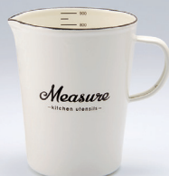
ホーローメジャーカップ・L [Measure]

材質: 本体/ほうろう用銅板 満水容量: 約450mL 商品サイズ: 約W14.0×D10.0×H7.0cm 商品重量: 約210g