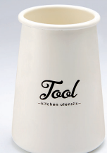
ホーローツールスタンド [Tool]

材質: 本体/ほうろう用銅板 満水容量: 約600mL 商品サイズ: 約W9.3×D9.3×H12.0cm 商品重量: 約220g