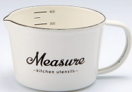
ホーローメジャーカップ・S [Measure]

材質: 本体/ほうろう用銅板 満水容量: 約380mL 商品サイズ: 約W12.0×D9.3×H7.5cm 商品重量: 約170g